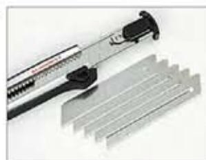
Magazin mit 6 Klingen zum schnellen Nachladen

Gehäuse aus unverwüßlichem Aluminium-Druckguss für den Extrem-Einsatz. Mit Magazin für bis zu 5 Ersatzklingen. Erlaubt den Dauereinsatz.